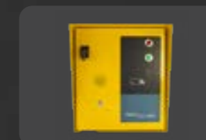
GST1 PLUS SERIE